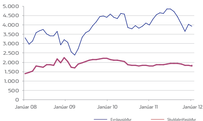
Erlendir sjóðir – gengisþróun