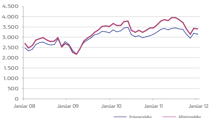
Erlendir sjóðir – gengisþróun

Fjárfestingar eru að hluta til í evrópskum hlutabréfum og á nýjum vaxandi hlutabréfamörkuðum.